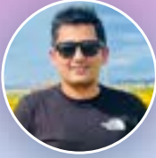
नविन अधिकारी पुर्व अध्यक्ष २०१७-२०१८

नयाँ वर्ष २०८२ को अवसरमा सम्पूर्ण दाजुमाई तथा दिदी बहिनीहरूसँगै स्वदेश तथा विदेमा रहनुहुने सम्पूर्ण नेपालीहरूमा सुख, शान्ति, समृद्धि, प्रगती र आरोग्यको शुभकामना व्यक्त गर्दछु। साथै फुकुओका नेपाल सोसाइटीले स्थापना कालको ३०औँ वर्षको अवसरमा प्रकाशन गर्न लागेको स्मारीकाको सफलताको शुभकामना व्यक्त गर्दछु।